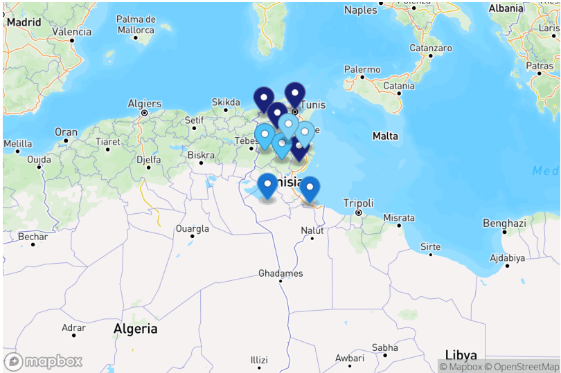
Projets par gouvernorat