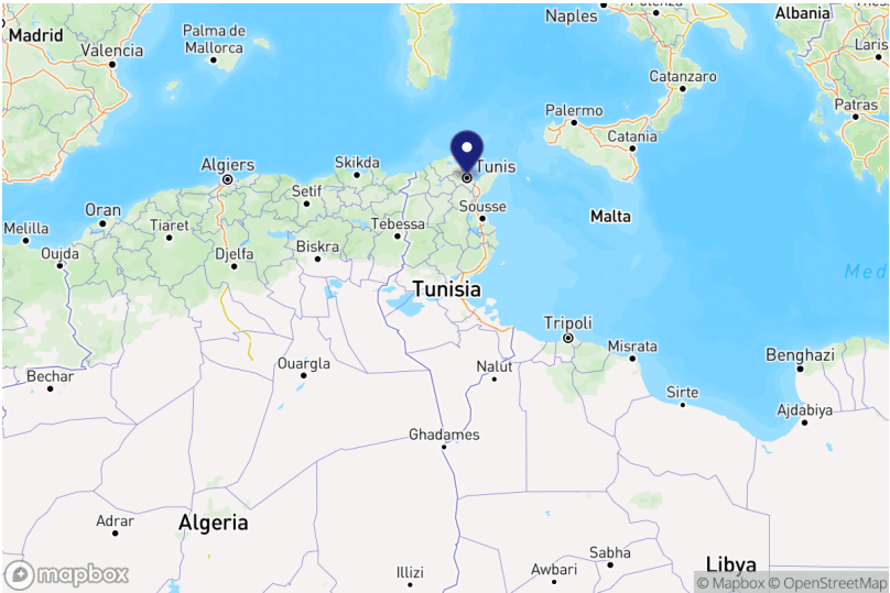
Projets par gouvernorat