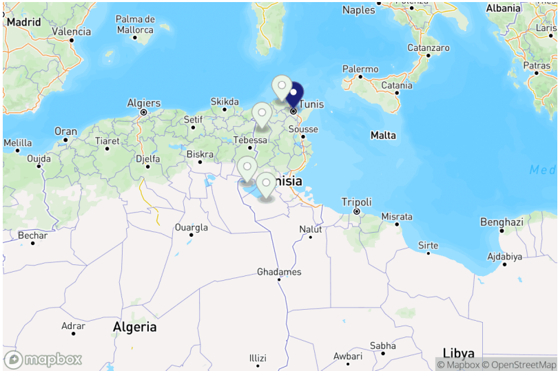
Projets par gouvernorat