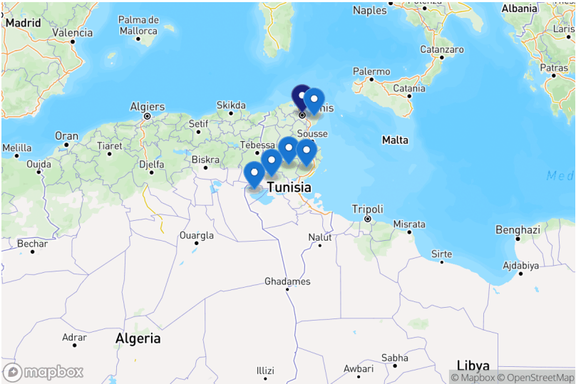
Projets par gouvernorat