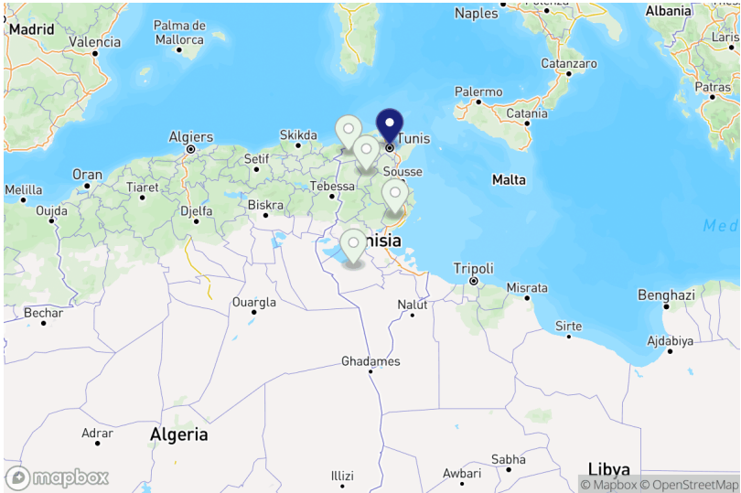
Projets par gouvernorat