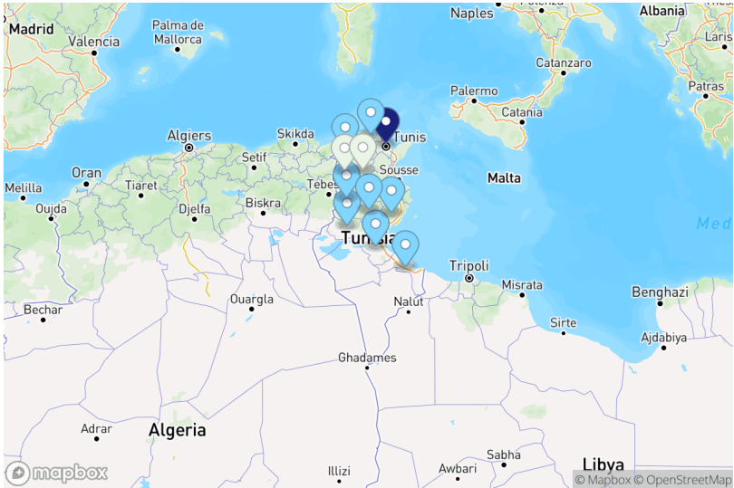
Projets par gouvernorat